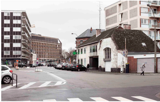
ca. 1903 - 1911 05/02/2019 - 13:41 Place du Marché aux Poissons vers l'avenue Frère-Orban

[...] Selon moi, tous les éléments sont fluides. La pierre même est fluide : une montagne s'effrite, devient sable. Ce n'est qu'une question de temps. C'est la courte durée de notre existence qui fait que nous appelons « dur » ou « mou » tel ou tel matériau. [...]