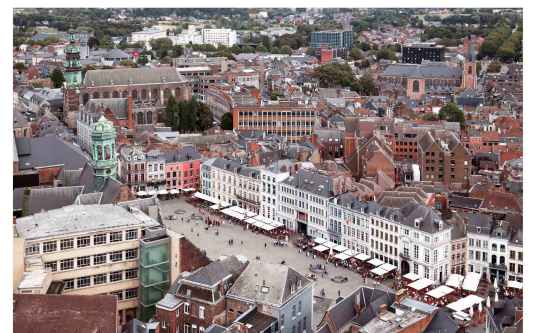
ca. 1902 - 1903 18/06/2019 - 15:23 Vers l'est, depuis le beffroi